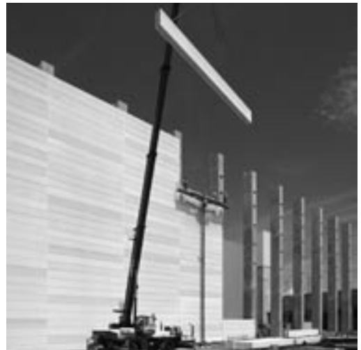
Sicherheit durch HEBEL Brandwände bei Daimler in Germersheim.

HEBEL Brandwandplatten dürfen nur in den vom Herstellwerk ausgelieferten Abmessungen eingebaut und nicht nachträglich gekürzt werden.