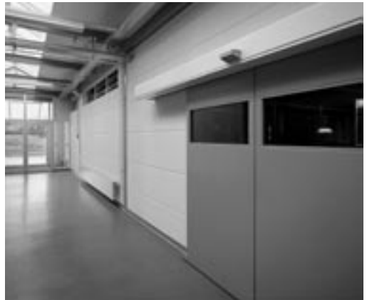
Brandwand aus HEBEL Brandwandplatten.

Für feuerbeständige Wände ist die Verglasungshöhe auf 5,0 m begrenzt, Längenbegrenzungen bestehen nicht, die Größe der Einzelscheiben beträgt \leq 1,40 \text{ m} \times 2,00 \text{ m} . Für verglaste Öffnun-