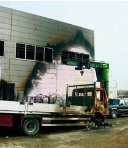
Das Produktionsgebäude aus Porenbeton hielt sowohl den Flammen als auch dem Druck einer Gasexplosion stand