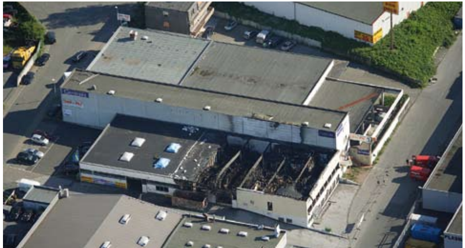
Das direkt an die abgebrannte Reifenhalle angrenzende Gebäude hat das Großfeuer unbeschadet überstanden. Seine Außenwände bestehen aus Porenbeton

Bauteile werden in Autoklaven bei ca. 190 °C und etwa 12 bar Dampfdruck gehärtet. Dabei reagiert der gemahlene Sand unter Beteiligung von Kalziumhydroxid und Wasser und es entsteht druckfester Porenbeton aus Kalzium-Silikat-Hydrat, das dem in der Natur vorkommenden Mineral Tobermorit entspricht und dem Baustoff seine mechanischen Eigenschaften verleiht. Der gesamte Produktionsprozess unterliegt einer strengen Eigen- und Fremdkontrolle. Hinzu kommt die kontinuierliche Qualitätssicherung nach DIN EN ISO 9001. Montagebauteile aus Hebel-Porenbeton sind als Dach- und Wandplatten erhältlich und ermöglichen die Realisierung von