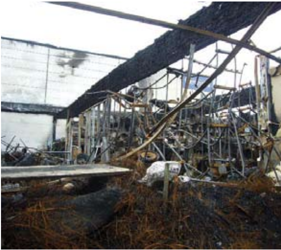
Brandursache war ein Container mit Altreifen. Er stand vor der Reifenhalle und wurde vermutlich durch Brandstifter angezündet

belgischen Großstadt hielt ein Produktionsgebäude aus Porenbeton sowohl den Flammen als auch dem Druck einer Gasexplosion stand. In einem anderen Fall löste ein technischer Defekt in einer Lagerhalle für Lacke, Farben und Chemikalentanks ein Feuer aus, das nicht nur auf das Produktionsgebäude der Lackfabrik, sondern auch auf die Produktionshalle eines angrenzenden Textilbetriebes übergriff. Die Löscharbeiten verzögerten sich durch die Explosion mehrerer Chemikalentanks und wurden außerdem durch herumfliegende Bauteile sowie die Rauchentwicklung enorm behindert. Die Lagerhalle wurde komplett, das Produktionsgebäude der Lackfabrik fast vollständig zerstört. Verschont blieben lediglich die Bauteile aus Porenbeton.