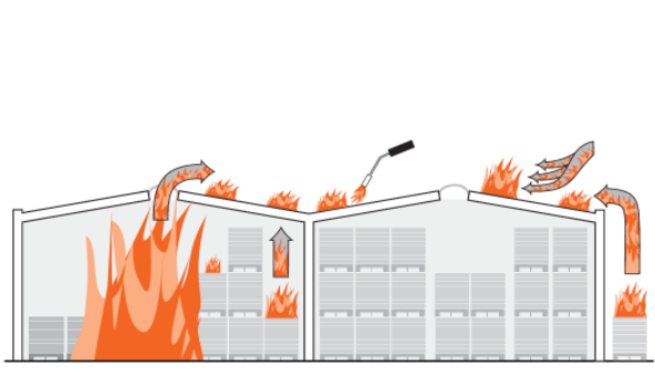
Möglichkeiten der Brandausbreitung über das Dach