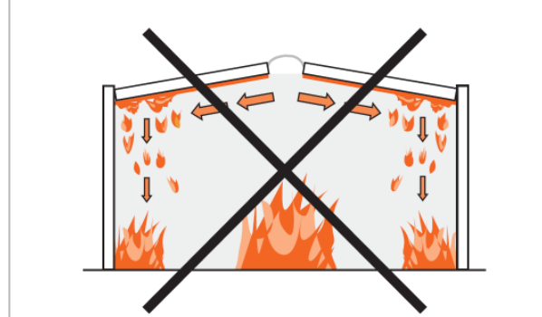
Kein brennendes Abtropfen